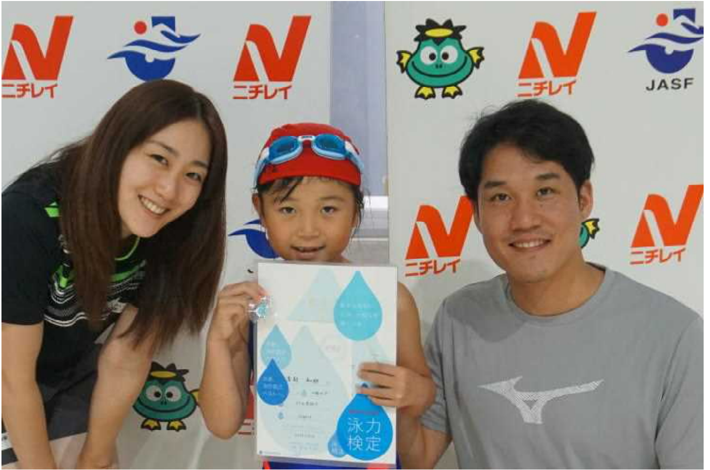
・ゲストから「記録証・バッジ」の授与