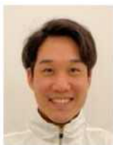
小堀 勇氣 (競泳)

姉の影響で水泳を始め、小学生時から徐々に頭角を現す。中・高と順調にタイムを伸ばし、大学1年で迎えたロンドン五輪の選考会では200m自由形で2位入賞。800mフリーリレーの代表選手に選出された。リオデジャネイロ五輪では萩野氏・松田氏・江原氏と組み800mフリーリレーで銅メダル獲得。52年ぶりの快挙となった。現在はミズノ株式会社で社業に就き、スポーツにおける幅広い分野でマーケティング活動を行っている。