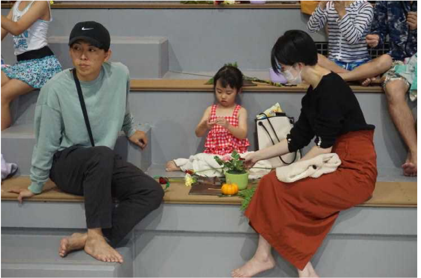
・水泳運動会参加者 親子で体験