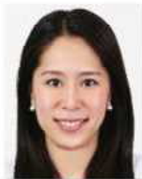
中川 真依 (飛込)

能美市出身。ソウルオリンピック出場。東京オリンピックでは飛込の審判員を務めた。現在は「スポーツクラブ浅田」の代表であり、子供たちの心身の育成に貢献している。