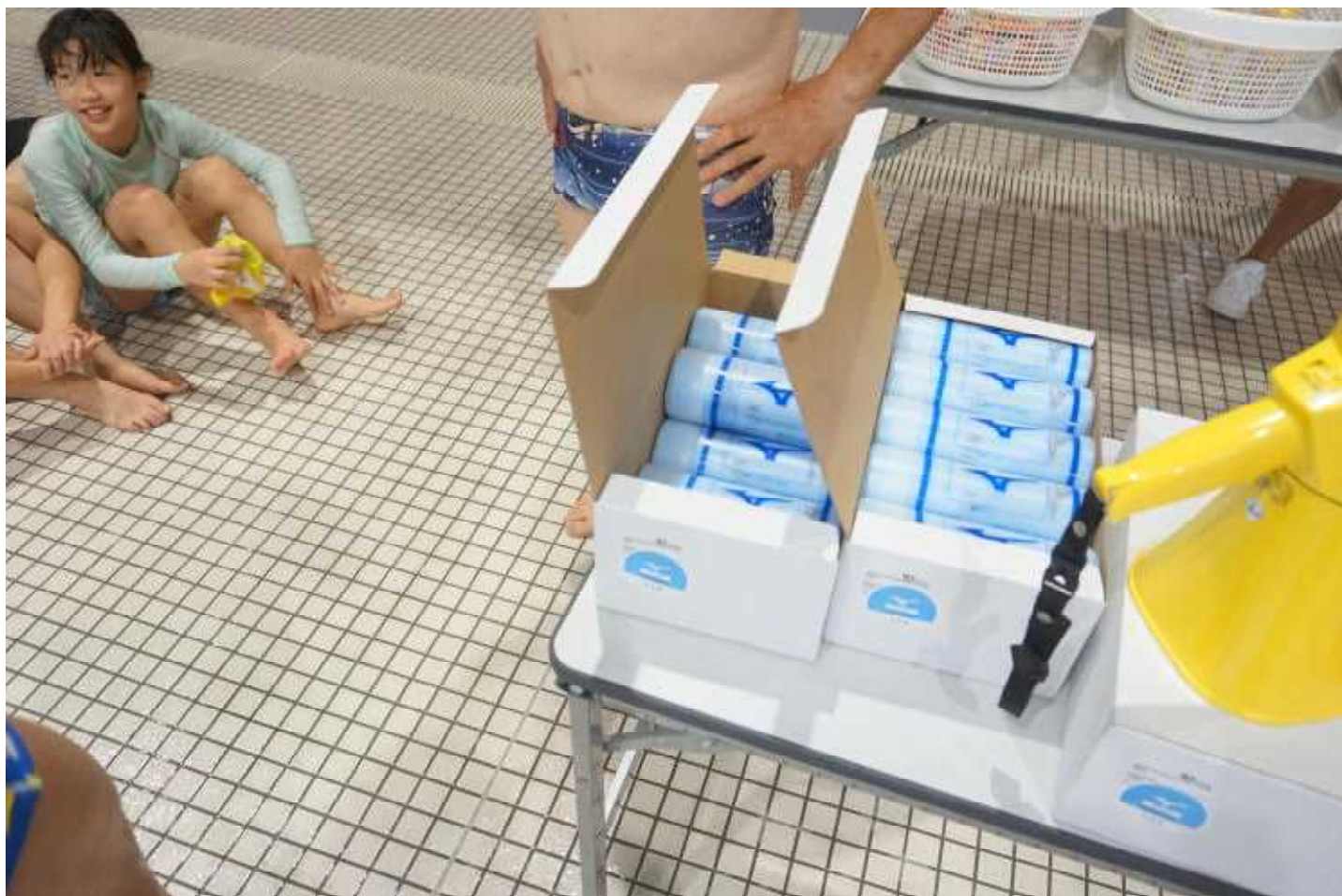
⑪セイムプレゼンター「小堀ゲスト」