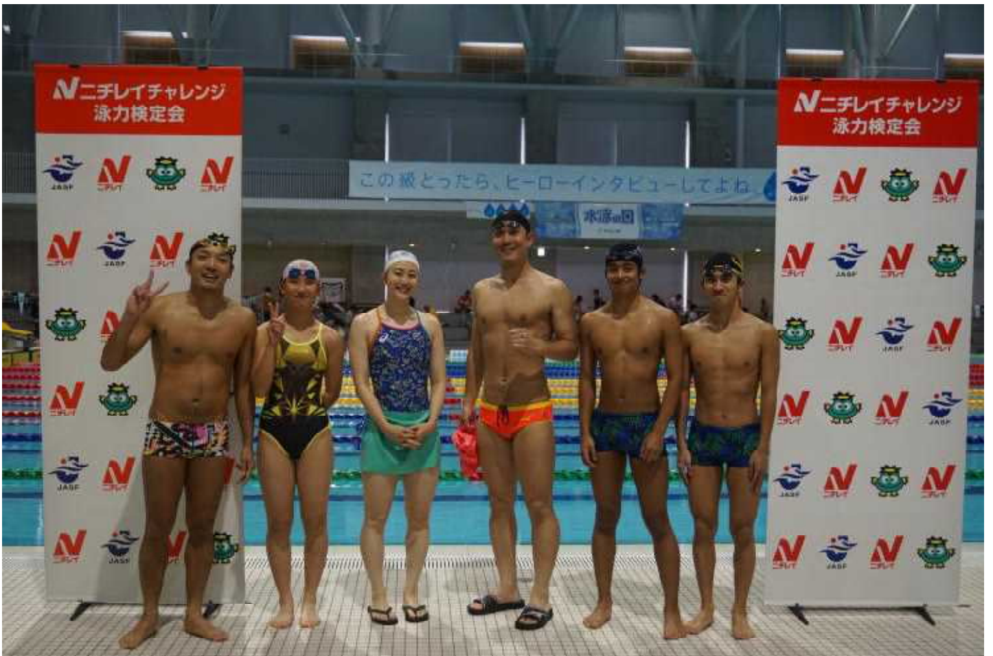
・南ファミリーチーム(左) ・オリンピックチーム(中) ・金沢大学水泳部チーム(右)